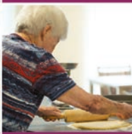
Kochen und backen