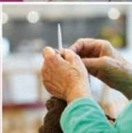
Zeit für Hobbys