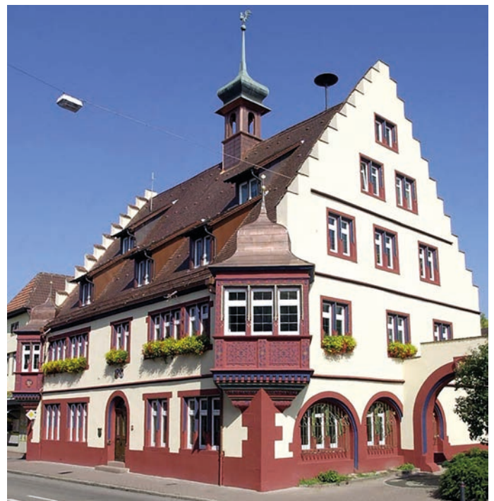
Das Kippenheimer Rathaus.

Am 1. Dezember 1146 rief der bekannte Kirchenlehrer Bernhard von Clairvaux in der Kippenheimer Kirche zum zweiten Kreuzzug auf. Offiziell wird Kippenheim erst-