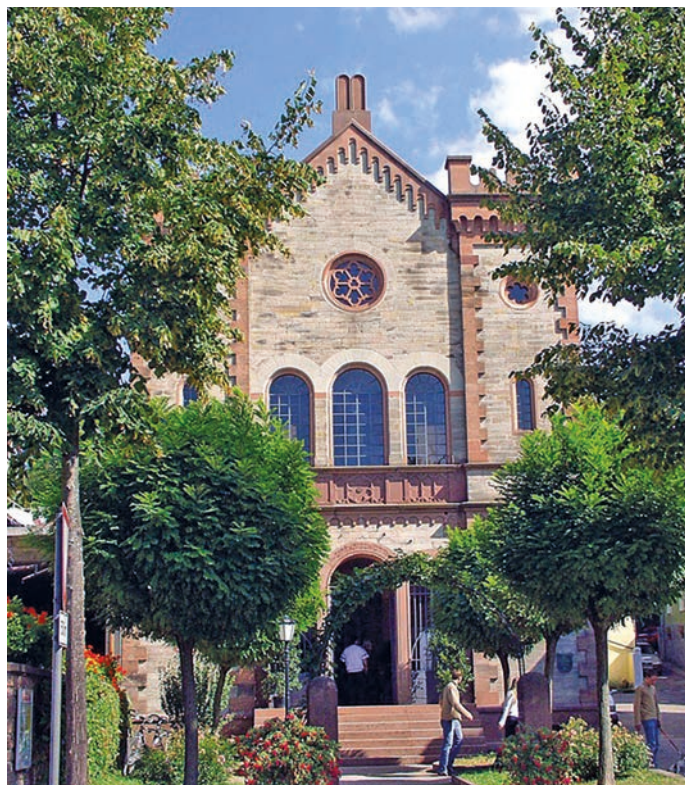
Die Kippenheimer Synagoge.

In Schmieheim erinnert neben dem jüdischen Schulhaus und dem Ritualbad in der Kirchstraße vor allem der Jüdische Verbandsfriedhof parallel zur Wallburger Straße an die jüdische Geschichte. Diese Grabstätte wurde 1682 eingerichtet und von den jüdischen Gemeinden der südlichen Ortenau gemeinsam getragen. Mit etwa 2.500 Gräbern ist die Grabstätte einer der größten jüdischen Friedhöfe Südbadens. Der älteste erhaltene Grabstein stammt von 1701. Die Schmieheimer Gemeinde