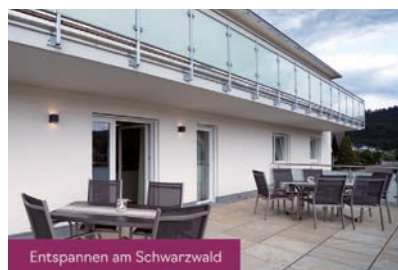
Entspannen am Schwarzwald