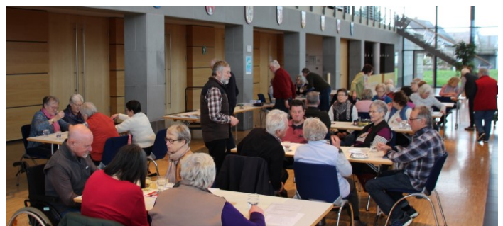
Spiel- und Babbeltreff in Freistett

Ebenfalls organisiert der Seniorenrat seit Anfang Februar einen „ Spiel- und Babbeltreff “: Das ideale Gedächtnistraining in geselliger Runde bei Kaffee und Kuchen. Dazu hat der Seniorenrat eine bunte Palette von Spielen angeschafft: Brettspiele, Kartenspiele, Würfelspiele und Wort-