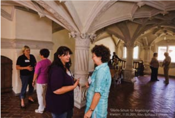
Beitrag des Landkreises zur Demenzoffensive: "Glücks-Schule" für betreuende Angehörige

die sich 1-2-mal pro Monat um die schriftlichen Dinge in ausgewählten Haushalten bei alten Menschen kümmern. Auch dieses Angebot soll evtl. um neue Engagierte erweitert werden. - Viele Besucher hatte der Pflegestützpunkt übrigens aus Anlass des Denkmaltages am 11. September. Das ehemalige Dekanatsgebäude wurde vom Publikum gestürmt und ermöglichte eine „wunderbare andere Öffentlichkeitsarbeit.“