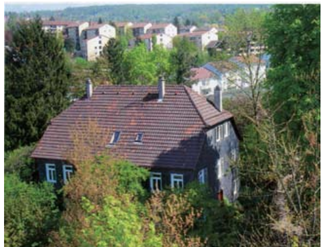
Das geplante Hospizhaus im ehem. Evang. Pfarrhaus der Martinskirche in Oberesslingen soll 8 Einzelzimmer umfassen und auch dem ambulanten Hospizdienst eine neue Heimat geben. Die Eröffnung ist für 2013 vorgesehen.

23 stationäre Hospize sind inzwischen in der Landesarbeitsgemeinschaft Baden-Württemberg zusammen geschlossen. Die meisten bieten, wie auch in Esslingen geplant, 8 Betten an. Und sie alle sind für ein weites Umfeld zuständig – man geht von einem Bedarf von einem Platz für je 50 000 EinwohnerInnen aus. Das bedeutet, dass sich die geplante Einrichtung in Esslingen für den ganzen Landkreis zuständig sieht.