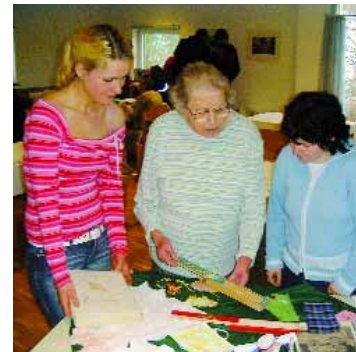
Abb.16: Gegenstände erzählen Geschichten.

Die Bezugnahme zum eigenen Leben bewegt in ganz besonderer Weise: etwa das Herstellen einer Trostkiste für mich selbst: Was ich mag, was mich