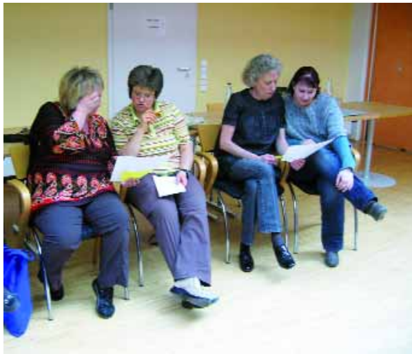
Abb.14: Reflexion eigener Erfahrungen.