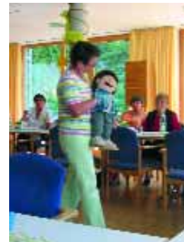
Abb.13: Anregung für den Kontakt: Handpuppen.