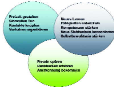
Abb. 6: Mehrwert des Freiwilligen-Engagements.

Zur Frage, was es bei der Durchführung einer Fortbildungsreihe für Demenzbegleiter im Einzelnen zu berücksichtigen gilt, geben die Erfahrungen