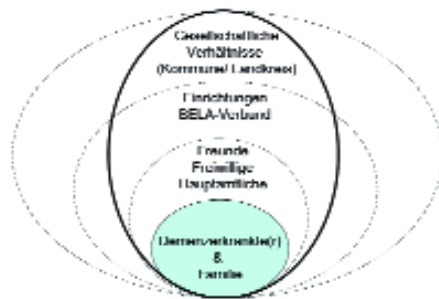
Abb. 10: Vernetzungsaufgaben der fachlichen Begleitung auf und zwischen den Ebenen.

Die Themen der einzelnen Kurseinheiten sind nicht als „Wissensbausteine“ formuliert, sondern enthalten bereits einen persönlichen Bezug. Sie sind ganz speziell auf die Entwicklung von Lebenswelten hin angelegt: In der Formulierung „Demenz geht uns alle an“ wird die Vorstellung einer gemeinsam gestalteten Lebenswelt deutlich, in der alle Bürger sich den Herausforderungen eines Lebens mit Demenz stellen müssen. Ebenso enthält die Formulierung des Themas „Erinnerungen öffnen Welten“ die Idee der Begegnung von „fremden Welten“: hier wird angedeutet, wie über die Weckung von Erinnerungen sich nicht nur die Welt der Erinnerung für den Demenzerkrankten auftut, sondern wie die Demenzbegleiter selbst einen Zugang zur Welt des Betreuten finden können – und auf einer anderen Ebene