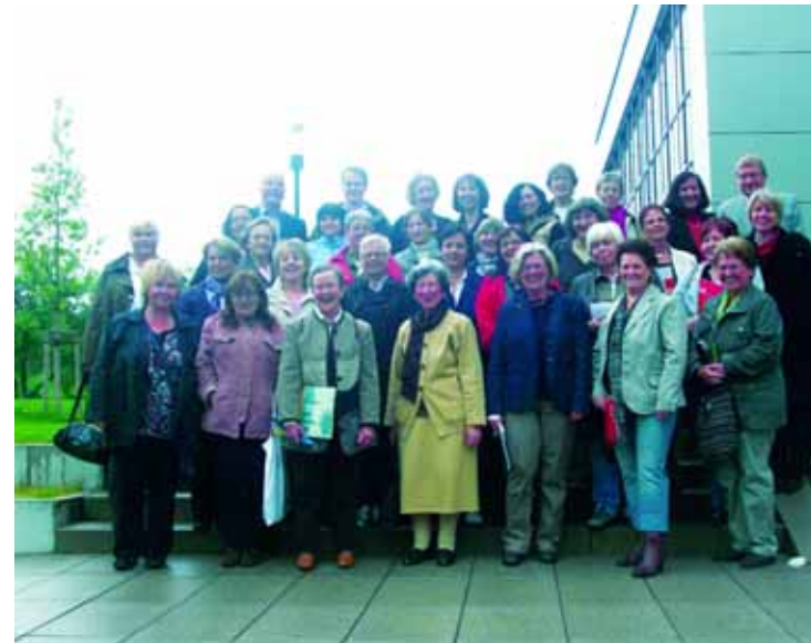
Abb. 20: Heiterer Abschluss beim Empfang des Landratsamts: 60 Freiwillige beschlossen eine fünfteilige Fortbildung zur Begleitung von Menschen mit Demenz mit einer Exkursion