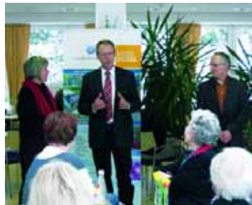
Abb. 9: Vernetztes Lernen im Landkreis Göppingen.