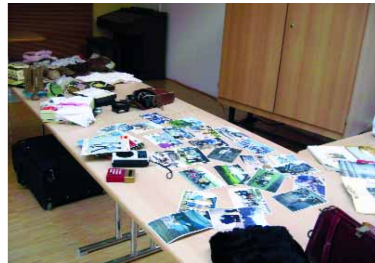
Abb.15: Erinnerungen anstoßen mit Hilfe von Gegenständen.