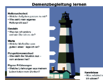
Abb. 4: Reflexionsanregung für die Lernbegleiter – ausgehend von den zu erwerbenden Kenntnissen.

Für die Reflexion mit den Lernbegleiterinnen selbst wurde ein Leitfaden mit Schaubild entwickelt. Dieser diene als Anregung, den Lernprozess der Gruppe auch unter diesem Gesichtspunkt zu gestalten. Das Bild des Leuchtturms sollte das Ziel verdeutlichen: Orientierung soll ermöglicht werden, damit das Zutrauen zum Engagement wächst.