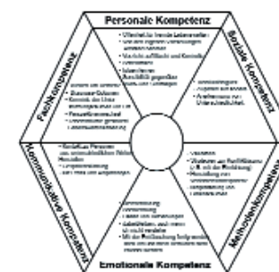
Abb. 2: Kompetenzen Demenzbegleitung – aus Sicht der Freiwilligen.

Mit den Fortbildungskursen zur Demenzbegleitung sind in erster Linie Bürger und Mitarbeiter angesprochen worden, die sich innerhalb von Pflegeheimen gemeinsam engagieren wollten. Diese sollten Grundinformationen über die Demenzerkrankten und Anregungen zum Umgang mit Demenzerkrankten in ihrem Alltag bekommen. Dieser Logik des an Lebensalltag und emotionalen Bezügen orientierten Lernarrangements sollten auch die eingeladenen Professionellen folgen. Bürgerschaftliches Lernen in einer Lerngruppe zielt jedoch nicht nur auf Informationsgewinnung und ein gemeinsames Nachdenken über die existentiellen Lebensthemen. Es geht auch um ein Vertraut-Werden mit den Einrichtungen im Nahraum und um eine Schärfung des Bewusstseins für die gesellschaftliche Bedeutung des Anliegens, die Pflege von Demenzerkrankten mitten ins Leben zu holen. So schafft die Fortbildung nicht