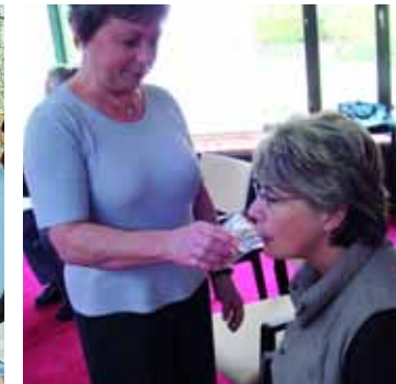
Abb.17: Unterstützung im Alltag üben.

Die kontinuierliche Reflexion des Gelernten und Erfahrenen in der Gruppe bildet einen zentralen Baustein der Fortbildungen. Hier wird das erworbene neue Wissen noch einmal in eigenen Worten formuliert. Auch können durch gezielte Fragen zur Reflexion neue Zuordnungen und Wertungen erfolgen. Das Gelernte wird in den bisherigen Wissensbestand integriert. Offene neue Fragen wer-