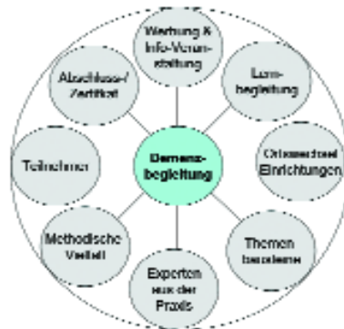
Abb. 7: Erfolgsfaktoren des Lernarrangements