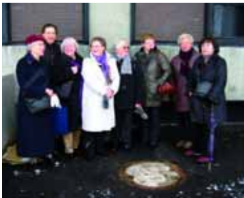
Abb. 8: Demenzbegleitung „on Tour“.