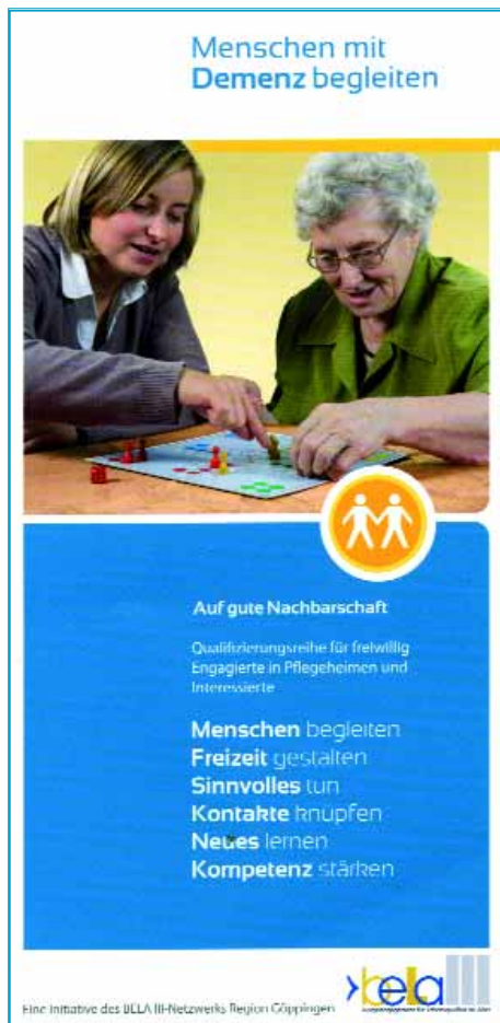
Abb.12: Informationsflyer zur Qualifizierungsreihe in der Region Göppingen