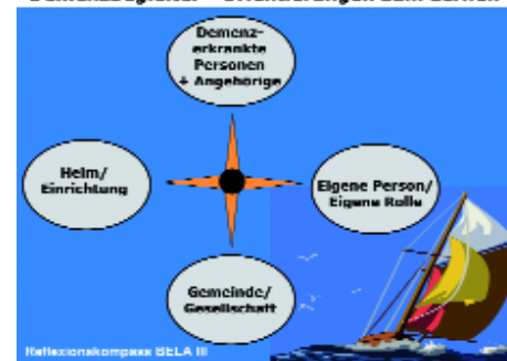
Abb. 17: Reflexionsschema für den Prozess.

Das Reflexionsschema wird von der Moderation nun schematisch auf einen Filpchartbogen aufgezeichnet. Die einzelnen Aspekte werden nacheinander mit der Gruppe reflektiert – die zentralen Aussagen werden notiert: